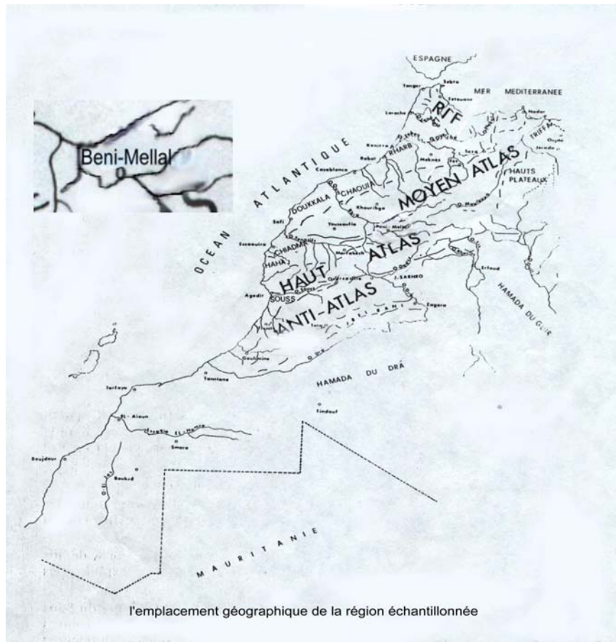
Figure 1. La carte du Maroc et la position de la région de Beni Mellal.

Pour le degré de signification du test \chi^2 : P>0.05 : une différence non significative (NS) P<0.05 : une différence significative (*) P<0.01 : une différence hautement significative (**) P<0.001 : une différence très hautement significative (***)