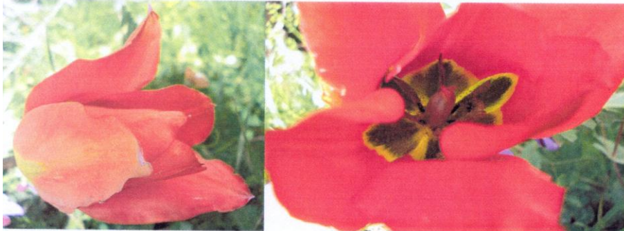
▲ Tulipa praecox Tenore ▲