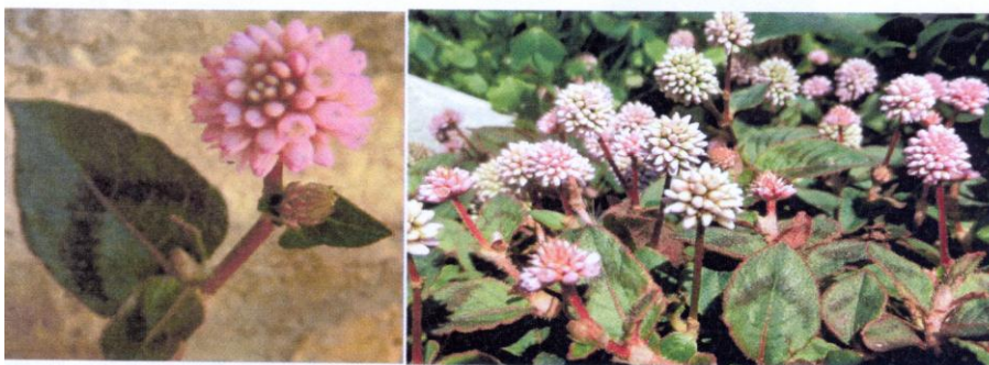
▲ Polygonum capitatum Buch. ▲